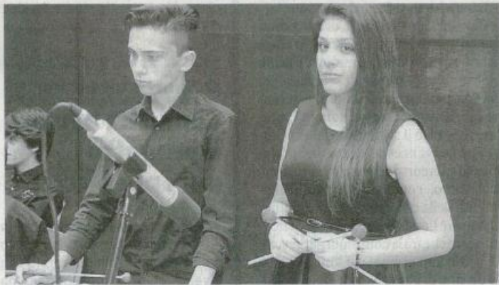
Due allievi della Nunzio Nasi

*** Si è concluso tra gli applausi a scena aperta del pubblico presente al Teatro "Nino Croce" (ex S. Barnaba) di Valderice il "Concerto di Primavera 2016" eseguito dagli alunni del Corso ad indirizzo musicale dell'Istituto Comprensivo "Nunzio Nasi" di Trapani. I centocinquanta allievi, diretti dai rispettivi docenti, hanno deliziato i presenti con diversi noti brani: "Song of ice and fire" di Djavadi, autore della colonna sonora della celebre serie TV "Trono di spade"; un medley di musiche che hanno rievocato lo stile 007 con l'esecuzione della cantante Adele la quale ha interpretato nella prima parte "Skyfall" e con la rievocazione del tema principale della famosissima colonna sonora nella seconda parte; le note che hanno accompagnato uno dei film più belli della storia del grande schermo, dove si intrecciano amore e passione